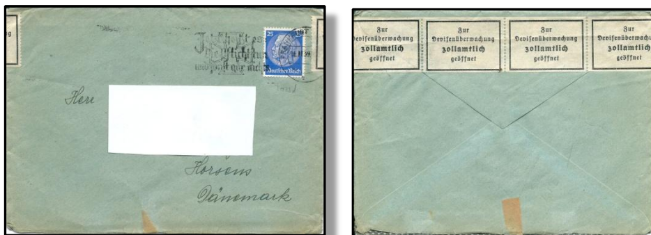
Fig. 2 Brevet hvori talen har været sendt

Som det tydeligt ses, har talen været foldet, bladet er på 16 sider, godt nok på tyndt papir, men må alligevel have vejet en del, hvilket formodentlig er grunden til at brevet er åbnet og kontrolleret