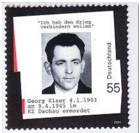
Fig. 4 AFA nr. 3237

Georg Elser blev skudt i koncentrationslejren Dachau den 9. april 1945, få uger før afslutningen af krigen.