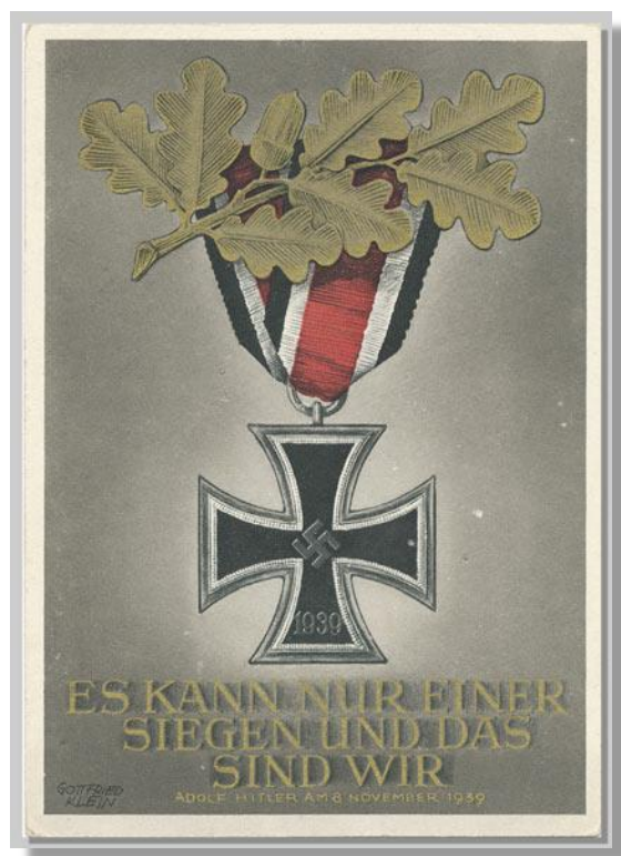
Fig. 3 Anledningen til Hitlers besøg i Bürgerbräukeller var mindedagen for det mislykkede kupforsøg d. 23. november 1923.

Det var almindeligt at Hitlers taler blev oversat til andre sprog og derefter udsendt til de, som ønskede at modtage dem. Desværre var der mange, der ønskede det.