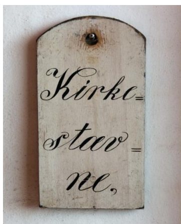
Figur 3. Skiltet er ophængt i våbenhuset, med teksten udad, hvis der var kirkestævne.

Et par eksempler, der viser, at også sognefogeden fulgte skik og brug og ikke viste unødigt nidkærhed i embedet. Han skulle jo stadig leve der bagefter.