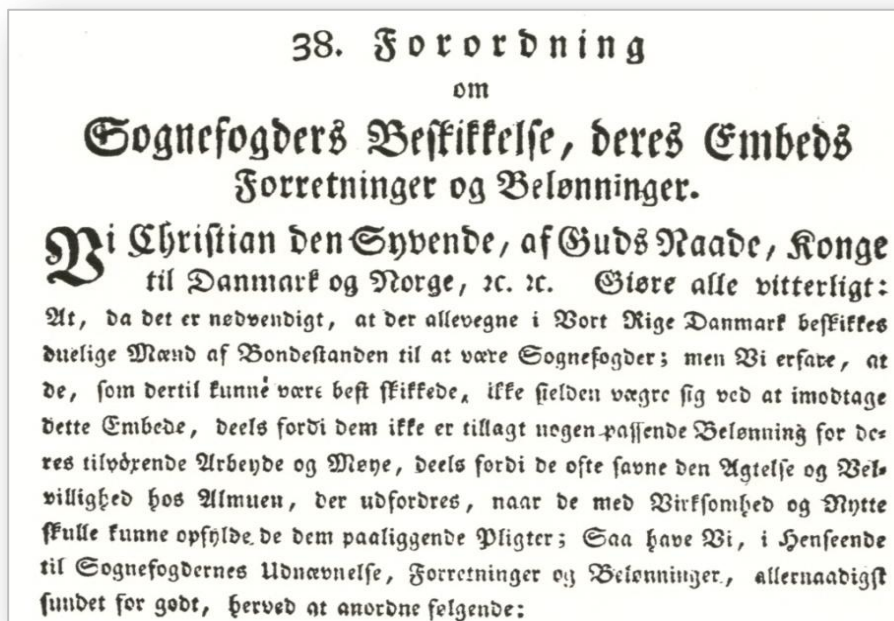
Figur 1. Scanning af Chr. den syvendes forordning.

Hvad en sognefoged skulle beskæftige sig med, hvordan og hvornår. Kongen siger også meget tydeligt, at det var amtmændene i ethvert sogn, der skulle beskikke en sognefoged, sognefogeden skulle vælges blandt almuen. Sognefogeden kunne i øvrigt godt samtidig være lægdsmand.