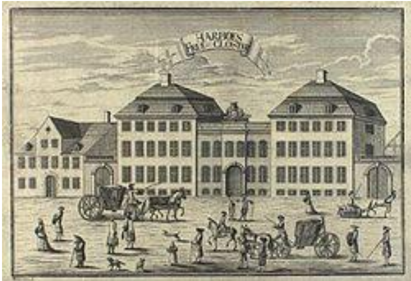
Det Harboeske enkefruekloster i København