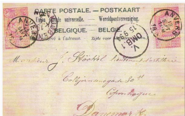
Fig.3a bagsiden af kort fra Belgien til København 1894