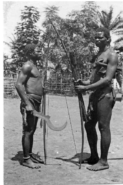
Fig. 7. To svært bevæbnede krigere fra en af stammerne i Congo.

Bornholm Congo Tur/retur, udgivet af nationalmuseet i 2003