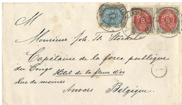
Fig. 1. Brevet er afsendt fra Juelsminde den 18 maj 1894 med jernbanen, afgang Juelsminde kl. 19.00 ankomst Horsens kl. 20.30. Takst 20 øre