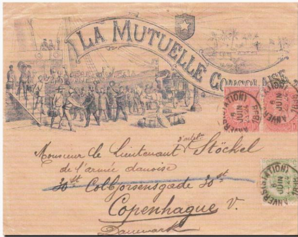
Fig. 6. Brev fra Anversation Belgien i 1898 til Copenhague takst 25 centimes.

Da han kom hjem derfra, blev han tilsynsførende ved "Den historiske Vaabensamling" som i 1928 blev omdøbt til "Tøjhusmuseet". Efter 37 år tog han sin afsked fra Tøjhusmuseet. Det var i høj grad hans fortjeneste, at museets samlinger blev organiseret og opstillet på den måde, som vi kender den i dag.