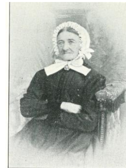
„Bedste“.