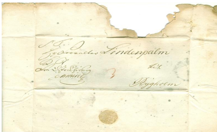
Fig. 1. Nedenfor en oversættelse af brevets forside